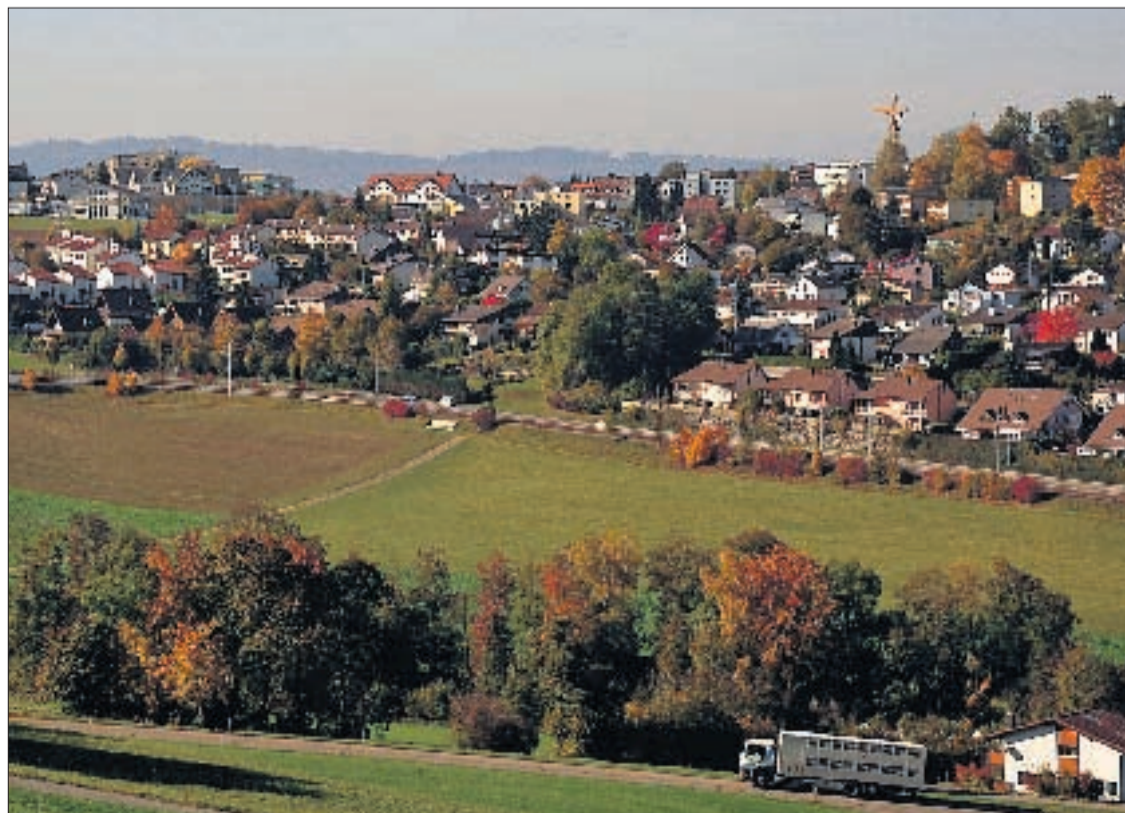
MUTSCHELLEN Sollen Berikon, Oberwil-Lieli, Rudolfstetten-Friedlisberg und Widen fusionieren? DNO

Ist die Stadt Mutschellen wirklich kein Tabu mehr? Klicken Sie auf den oben stehenden Link und geben Sie online Ihre Stimme für oder gegen die Stadt Mutschellen ab.