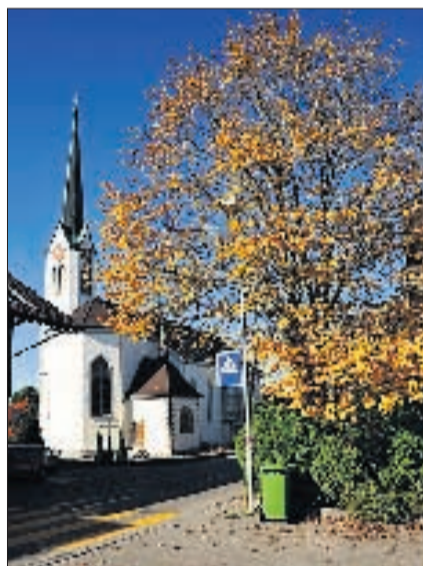
BERIKON Kirche St. Mauritius. DNO