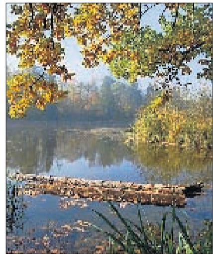
FISCHBACH-GÖSLIKON Am Mösli. SL