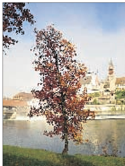
BREMGARTEN Muri-Amthof. DNO