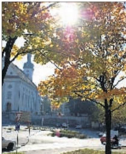
WOHLEN Bei der Kirche. ES