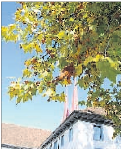
MURI Im Klosterhof. ES

Ein Streifzug durch die Region erfreut das Auge und wärmt das Gemüt