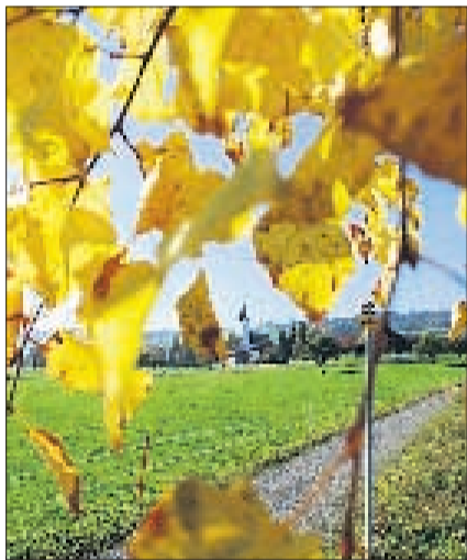
BEINWIL Am Burkardsweg. ES