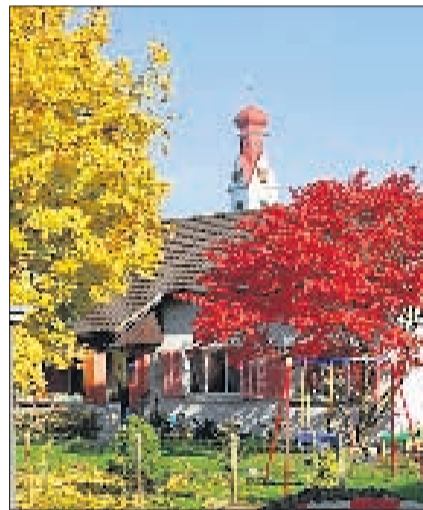
NIEDERWIL Mit Blick auf die Kirche. SL