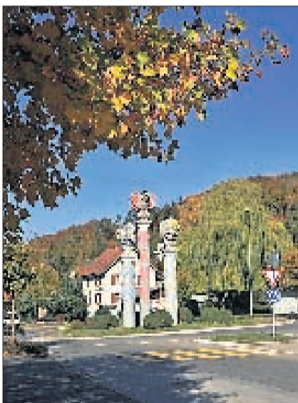
WIDEN Am Eulenkreisel. DNO