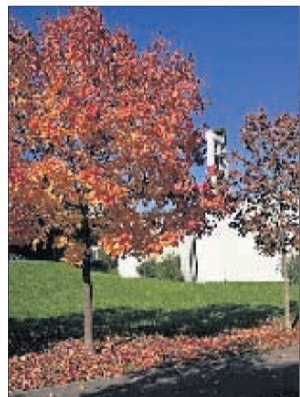
RUDOLFSTETTEN Christkönigkirche. DNO